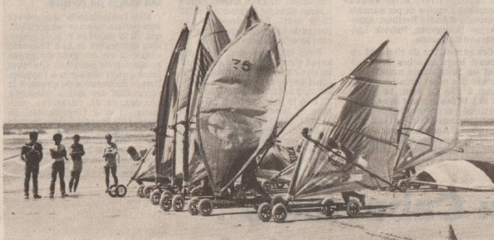
● Du vent dans les voiles.

Depuis ce week-end, La Torche peut inscrire une activité supplémentaire à son palmarès, le speed-sail. Il y avait bien eu auparavant des démonstrations de planches sur roues, mais jamais encore d'épreuve de niveau national. C'est fait.