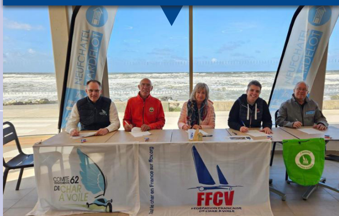
La convention est signée ... top départ de l'organisation